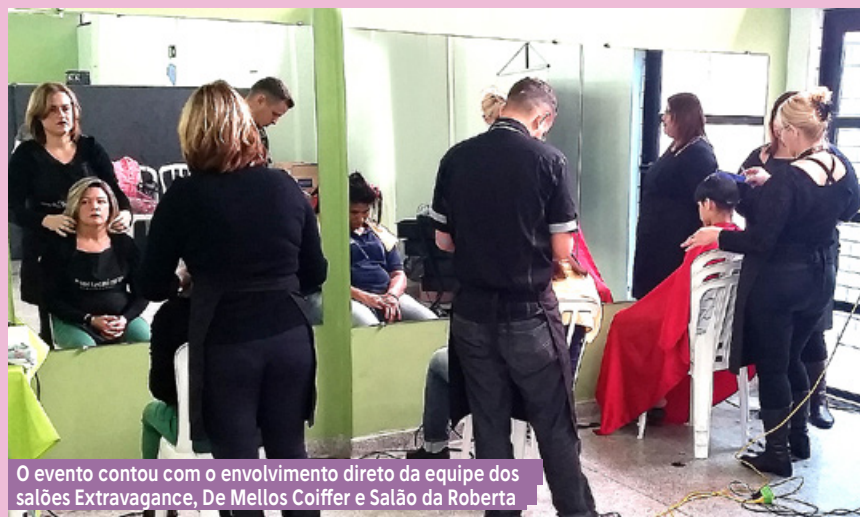
O evento contou com o envolvimento direto da equipe dos salões Extravagance, De Mellos Coiffer e Salão da Roberta

atualmente, com a participação de três salões: Extravagance, De Mellos e Salão da Roberta. Desde que foi montado, em 16 de abril, a equipe – composta por cerca de 15 pessoas, se reúne semanalmente para estudar cada detalhe do projeto. “Agora que realizamos a primeira ação,