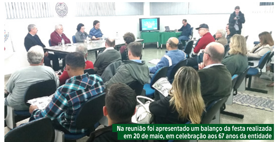
Na reunião foi apresentado um balanço da festa realizada em 20 de maio, em celebração aos 67 anos da entidade

Na noite de 15 de junho, aconteceu a reunião mensal da diretoria da Associação Comercial de São Vicente na sede da entidade. O evento iniciou com representantes da Unimed Santos apresentando uma proposta de plano exclusiva aos associados locais. A indicação será enviada por e-mail aos filiados da instituição.